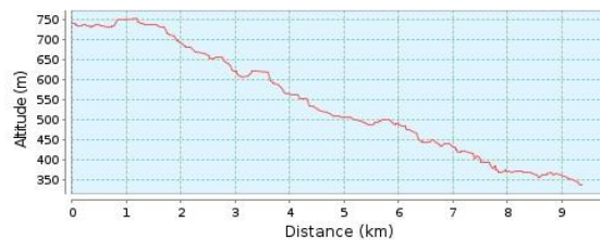
Altitude Profile (336 m to 754 m)

Az útvonal lakott területen kívül, aszfaltozott műúton halad. Végig lejtős szakasz. Szintidő letelte 17:30-kor