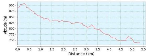
Altitude Profile (739 m to 907 m)

Az útvonal lakott területen kívül, aszfaltozott műúton halad. Végig lejtős szakasz. Szintidő letelte 16:15-kor