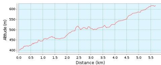
Magasságprofil (399 m - 618 m)