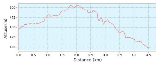
Magasságprofil (397 m - 506 m)